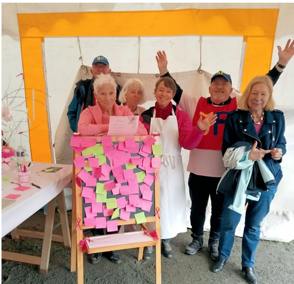
Les marcheuses et marcheurs ont laissé sur notre tableau et sur notre table de nombreux et bien jolis messages d'espoir.